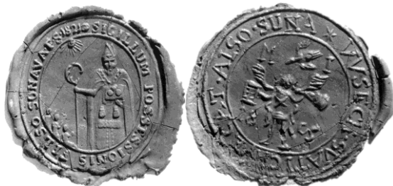
Obecné pečate z 19.storočia