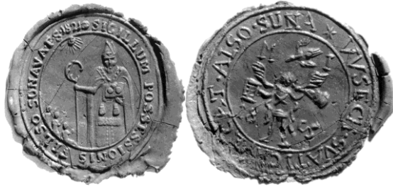
Obecné pečate z 19.storočia